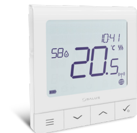
Agora compatível com os termostatos SALUS Quantum SQ 610