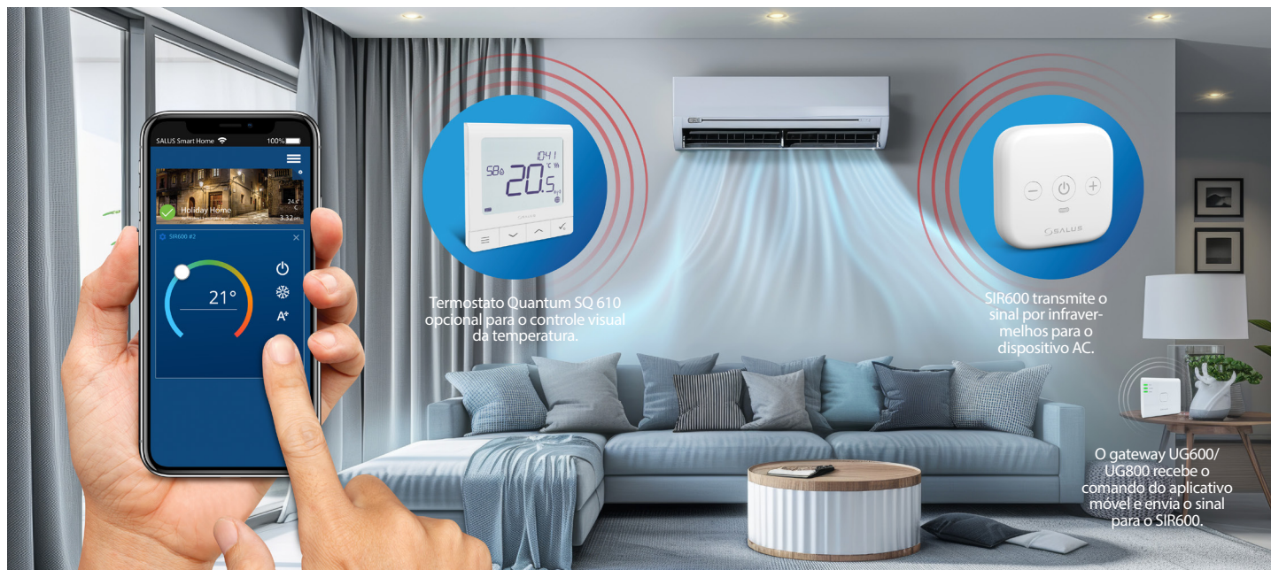
Termostato Quantum SQ 610 opcional para o controlo visual da temperatura.