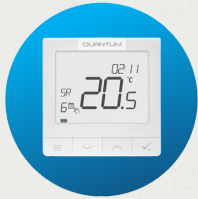
Termostat inteligent IT700