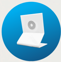
Suport de birou (disponibil separat)