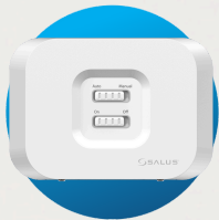
WZ600 Receptor WiFi Zigbee