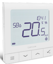
Nyt yhteensopiva SALUS SQ610RF Kvantti-termostaatti