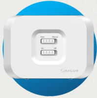
WZ600 WiFi Zigbee Receiver