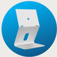
Docking station (separat erhältlich)